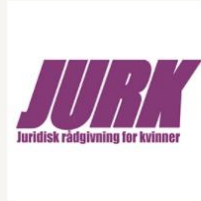
Juridisk Rådgivning for Kvinner