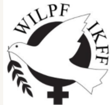
Internasjonal kvinneliga for fred og frihet