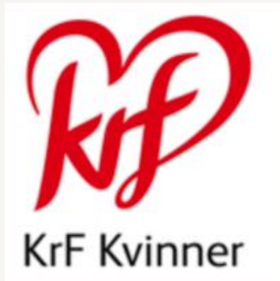
Kristelig Folkepartis Kvinner