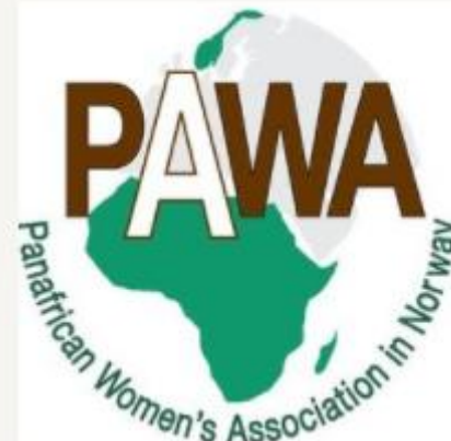
Pan-African Women's Association