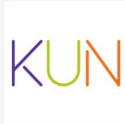
KUN - Senter for kunnskap og likestilling