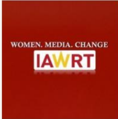
International Association of Women in Radio and Television, Norge