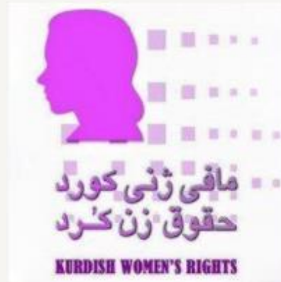
Kurdish Women's Rights