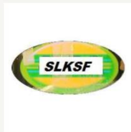
Somaliske kvinners solidaritetsforening